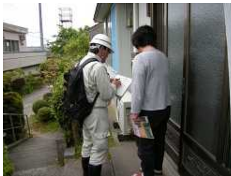
アンケート調査、聞き取り状況 (上)