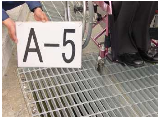
点検結果2 (キャスターが溝にはまる)