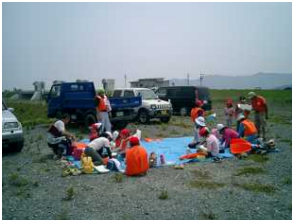
【ワンドには何があったかな！みんなでスケッチ】