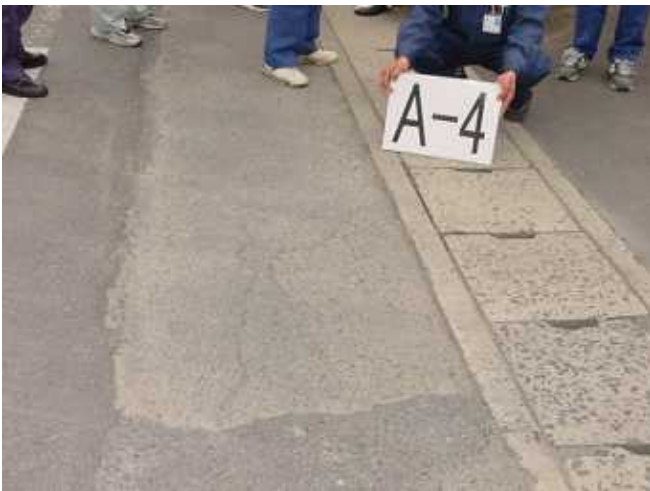
点検結果1 (歩道と側溝の段差)