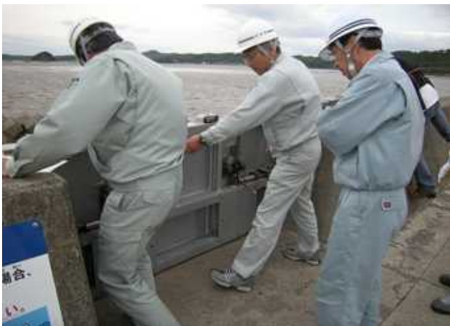
河北新報の記事（6月2日付け）