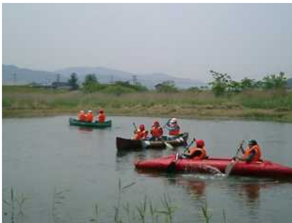
【カヌーでスイスイ】