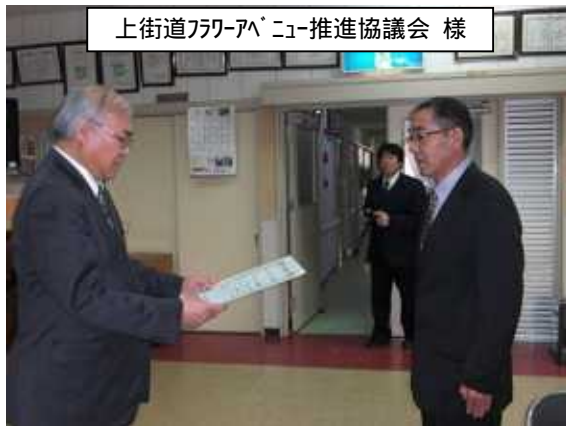
上街道ワーカーアニュー推進協議会 様