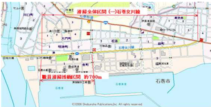
【クリーンアップ 区間その1】