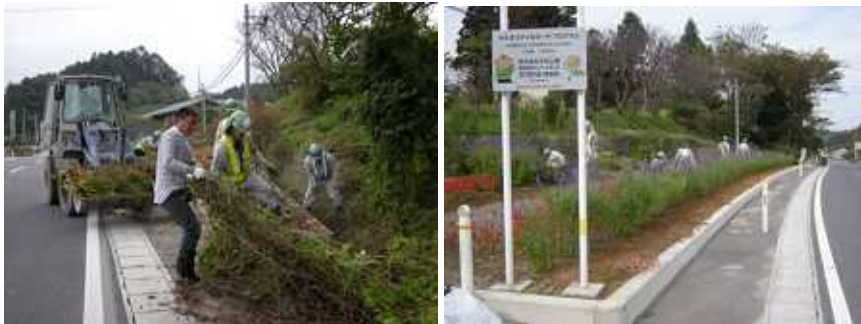
【石巻鹿島台大衡線 清掃活動】