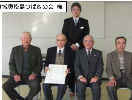
宮城奥松島つばきの会 様