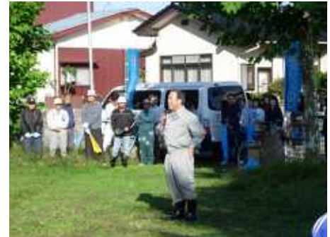
【定川 阿部東松島市長】