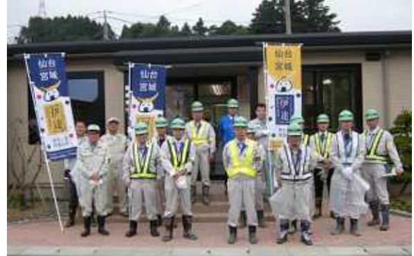
【石巻鹿島台大衡線 参加者の皆さん】