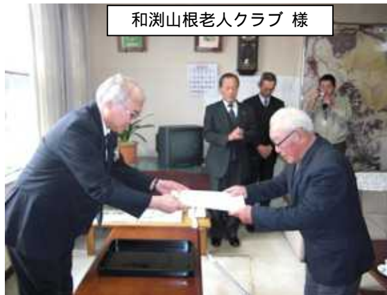
和湊山根老人クラブ 様