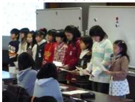
子どもたちによる意見・交換