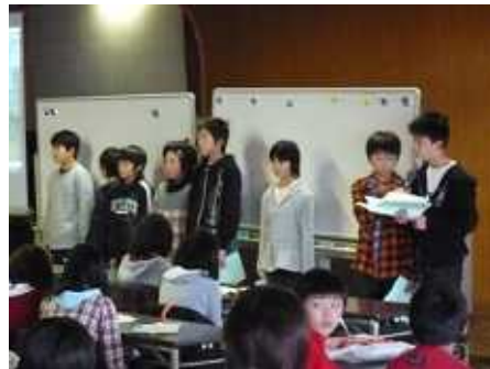
石巻市立住吉小学校