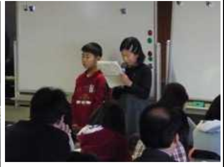
東松島市立赤井南小学校