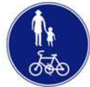
自転車・歩行者専用

また、下のような標識がある場合は、自転車専用道路では歩行者は通行できませんし、歩行者専用道路では、自転車は走行してはいけません。