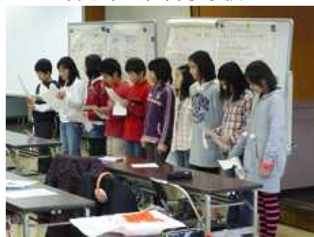
めだかっこクラブ