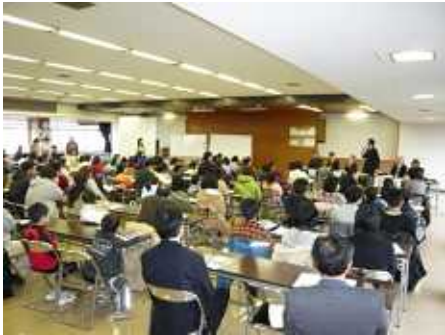
石巻市立吉浜小学校