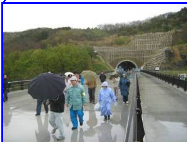
悪天候のなか傘をさしながら見学 天気がよければな～ 残念