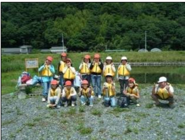
【みんなで記念撮影。いい笑顔ですね。】