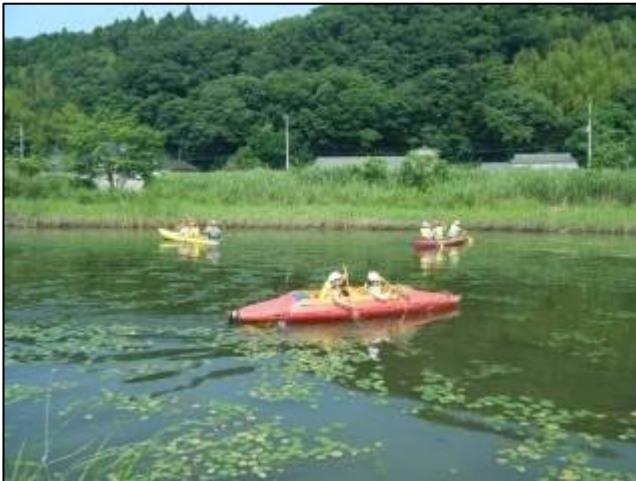
【ワンドの中でカヌーの練習中！】