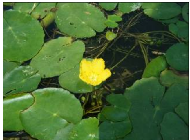
【可憐なアサザの花】

■ 問合せ先: 宮城県東部土木事務所 河川砂防第二班 Tel0225-94-8785(直通)