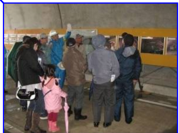
トンネル内にパネルを展示 職員の説明を熱心に聞く見学者の皆さん

■ 問合せ先：宮城県東部土木事務所 道路建設第一班 Tel0225-94-8763(直通)