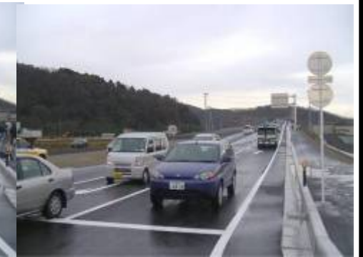
供用開始5分後にはかなりの台数が

■問合せ先:宮城県東部土木事務所 道路建設第一班 TEL0225-94-8763(直通)