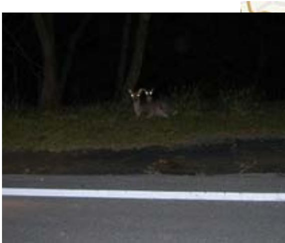
シカの生息状況(牡鹿半島公園線)