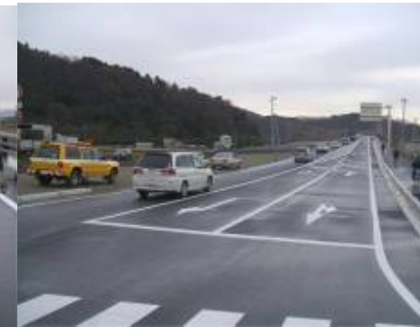
一般供用開始直後の様子