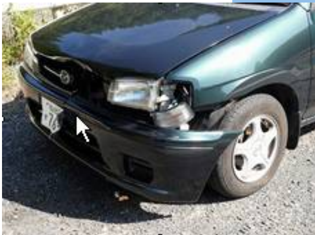
シカと衝突した車両の破損状況