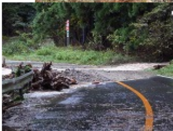
石巻市渡波クルマミ沢土石流