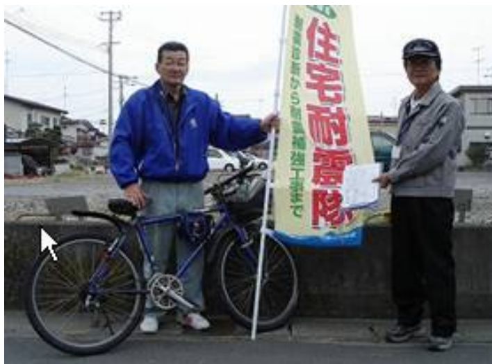
訪問員の方々(石巻市)