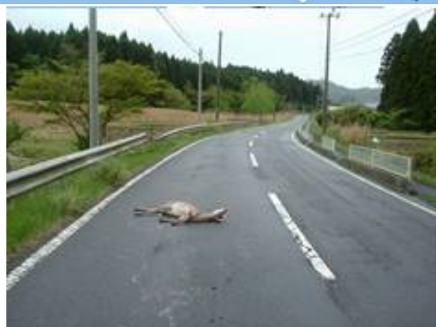
車両と衝突したシカ

■問合せ先: 宮城県東部土木事務所 道路管理班 TEL0225-94-8762(直通)