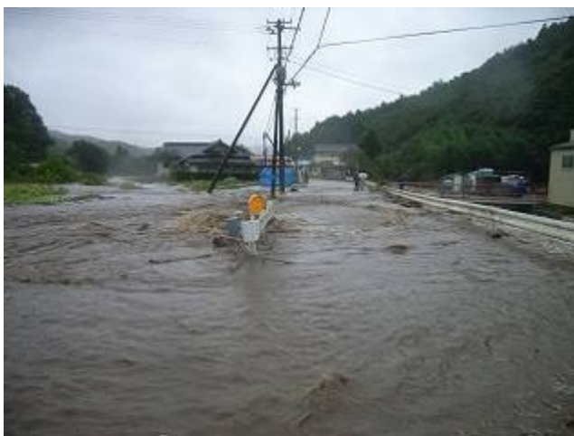
大沢川 石巻市北上町女川 河川越水