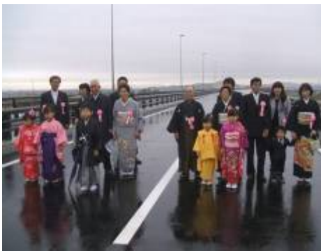
ふた組の親子三代による渡り初め