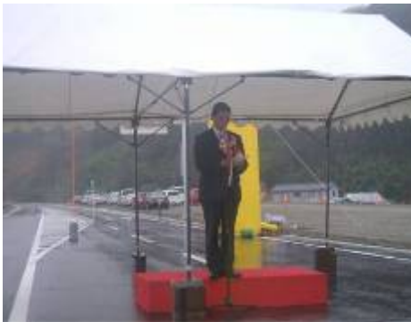
村井宮城県知事あいさつ