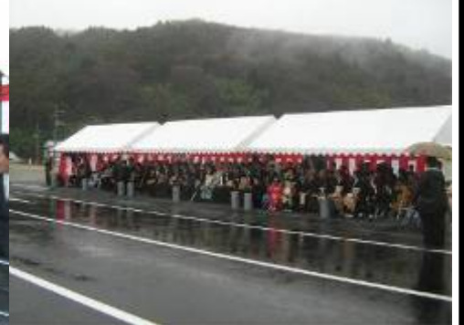
多数の来賓の方々に参加いただきました