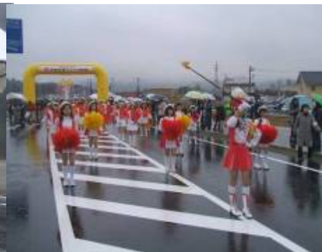
稲井小学校鼓笛隊を先頭に参加者全員でパレード