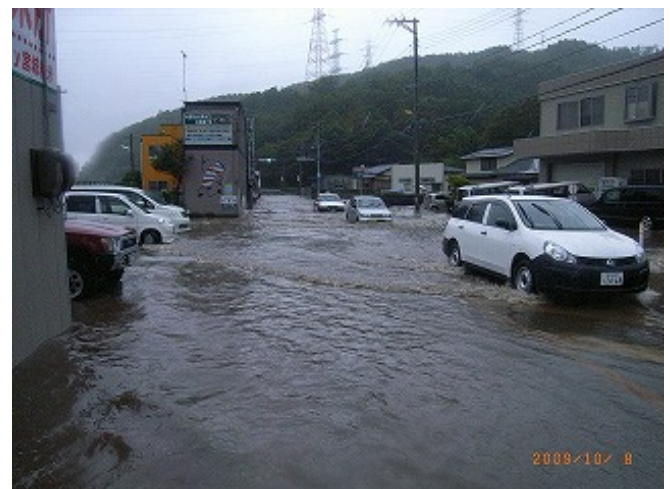
(国)398号 女川町浦宿 路面冠水

■問合せ先: 宮城県東部土木事務所 道路管理班 河川砂防第1、2班 TEL0225-94-8762,8785(直通)