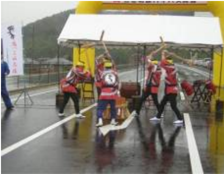
地元「馬っこ山太鼓の会」による「もち振る舞い」

国道398号石巻北部バイパス南境工区の供用開始に先立ち、国道398号改良整備促進期成同盟会主催による「開通式」が行われ、地域の方々と共に盛大に開通を祝いました。無事開通に至り、用地買収に御協力いただきました地権者の方や、工事中御迷惑をおかけした地域の方々、関係者の皆様に改めてお礼申し上げます。