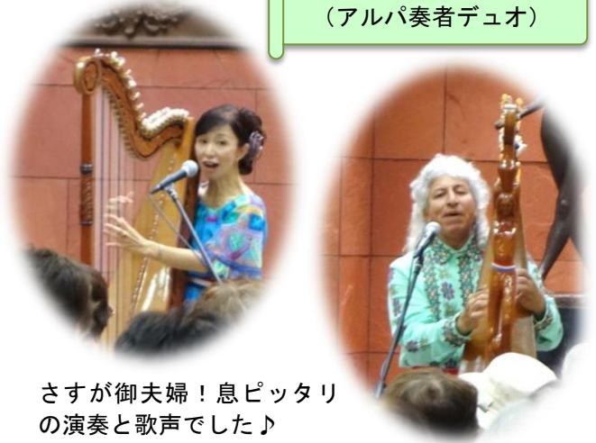
さすが御夫婦！息ピッタリの演奏と歌声でした♪