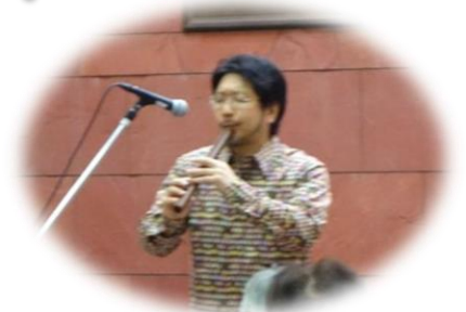
本日はケーナだけでなく、ペルー発祥の打楽器「カホン」も演奏していただきました。