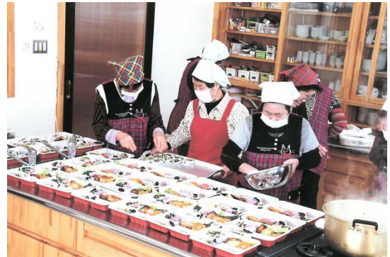
手分けしてお弁当箱に詰め込んでいきます

毎年12月・2月・3月には、館矢間地区内の一人暮らしの高齢者世帯へお弁当配達を行っています。配達の案内や希望者の取りまとめは民生委員に協力してもらっており、現在の配達数は40～50軒ほどです。