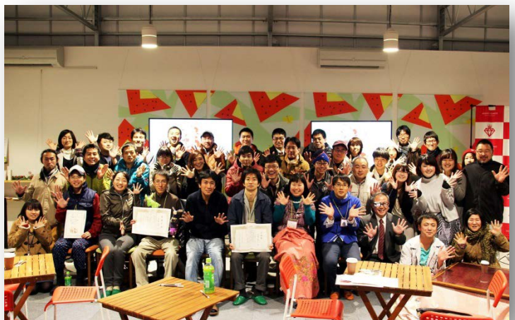
伊達ルネッサンス塾 参加者のみなさん

2016年6月には、伊達ルネッサンス塾第3期生を募集開始予定です。未来を担う若者の活動への応援をよろしくお願いいたします！