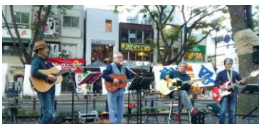
モダンフォークリバイバル 13:15～

12月 6 日 (日) 骨髄バンク支援チャリティライブ 13時15分～ 緑の広場