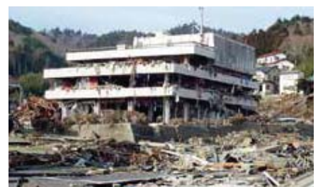
女川町(3階まで浸水した役場庁舎)