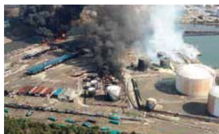
多賀城市(石油コンビナート火災)