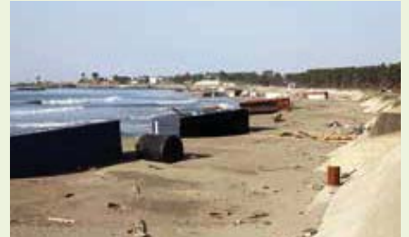
七ヶ浜町(コンテナが散乱する葛蒲田海岸)