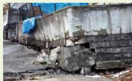
仙台市(崩れた擁壁)