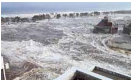
岩沼市(県南浄化センターに押し寄せる津波)