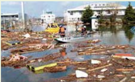
岩沼市(仙台空港周辺 救命ボートで避難する被災者)