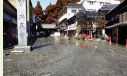
松島町(泥で覆われた瑞巖寺門前)