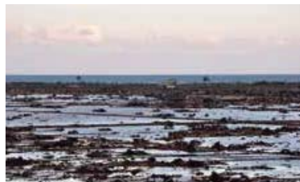
山元町(津波被害を受けた坂元駅周辺の農地)