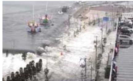
塩竈市(観光船発着場の岸壁に乗り上げる津波)