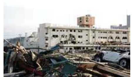
南三陸町(大量のがれぎに囲まれた公立志津川病院周辺市街地)