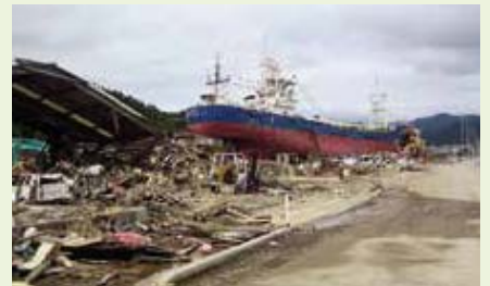
気仙沼市(津波で陸に打ち上げられた大型漁船)