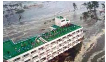
仙台市(孤立する荒浜小学校)