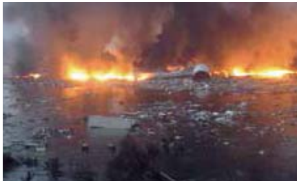
気仙沼市(気仙沼湾の海面火災)