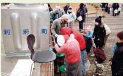
利府町(応急給水に並ぶ住民の列)