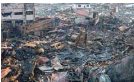
石巻市(門脇小学校付近の延焼した自動車などの残骸)