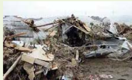
亶理町(津波で倒壊したイチゴ栽培ハウス)