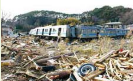
東松島市(津波で押し流された仙石線の車両)