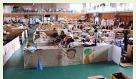
名取市(避難所として使用された学校の体育館)