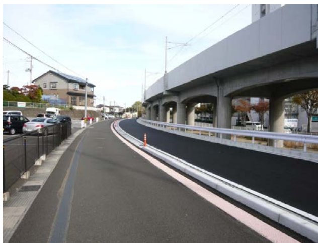
(都) 駅西小路線<船橋志引線側から駅方向>