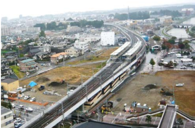
高架化のようす1(塩竈方面を望む)