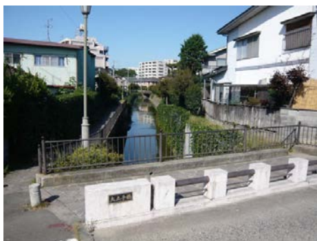
小学校前の「野田の玉川」