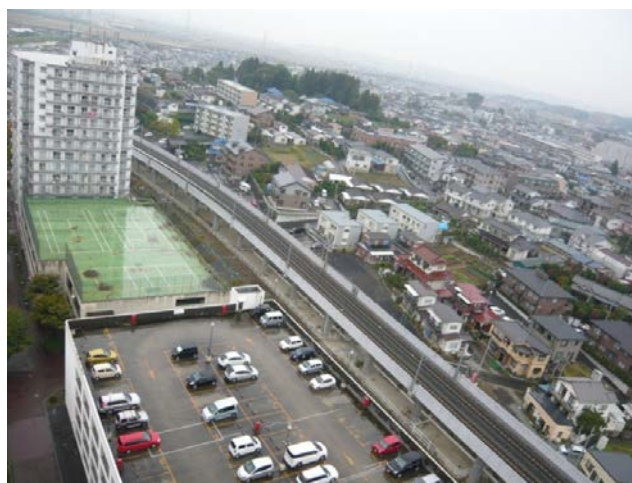
高架化のようす2(仙台方面を望む)