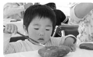
ストーン ペインティング