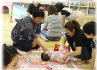
育児講座「講師の先生とわらべうた遊び」