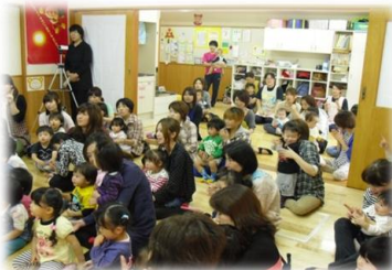
劇団21による「親子で楽しむお話し会」