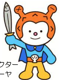
市観光キャラクター 海の子ほやぼーや