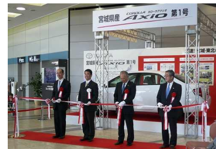
仙台空港での展示の様子 (H23.9.23~H24.5.10)