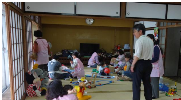
地域の子育てサポーターさんは託児ボランティアで大活躍！