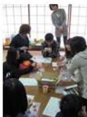
パンダのサンタキャンドル を作りました

平成26年1月19日（日）には第2回を開催し、餅つきや昔の遊びで交流を図ります。