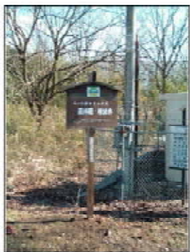
葎神堰に設置した三十六景看板