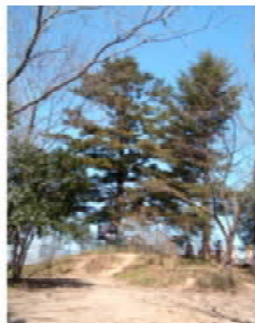
船岡城址公園「桜ノ木」

桜の名所100選に選ばれている「船岡城址公園・白石川堤」(柴田町・大河原町)の桜を、春のうららかな気候を満喫しながら、のんびりと楽しんでみませんか。 船岡駅を出発し、小高い山一面に咲き誇る「船岡城址公園」の桜を満喫。小説「桜ノ木は残った」で有名な桜ノ木付近からは、大河原からつく桜並木を一望できます。 船岡城址公園を下り、船岡のまちには、歴史の息づかいを感じさせてくれる寺院や商家などもあり、足を伸ばしてみるのも良いかも知れません。 船岡駅にもどり、線路を渡る連絡通路を昇って白石川堤防へ。堤防沿いの桜並木をのんびり大河原町方面に向かいます。30分ほど歩くと「残雪の蔵王と桜並木のベストスポット」「葎神堰」に到着。ここであなたならではのベストショットを1枚いかがですか。 「一目千本桜」の並木をゆっくりゆっくり歩く。そんなせいたく時間の使い方もあるんだと実感できるはず。 その後、大河原町内の末広橋を渡り、対岸を下流方面に進むと「船岡城址公園」とは白石川を挟んで向かいに位置する「葎神山」へ。 国道4号沿いから続く約280段の階段を登り、標高94mの山頂付近からは「船岡城址公園」と「白石川堤防の一目千本桜」を同時に眺めることができる、せいたくなぜいたくなスポットです。 葎神山の山頂付近には、多くの観音様がお祀りされています。 もちろん、蔵王の眺望もベスト。 春の一日桜に囲まれて、心のリフレッシュを！！