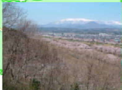
船岡城址公園(柴田町)