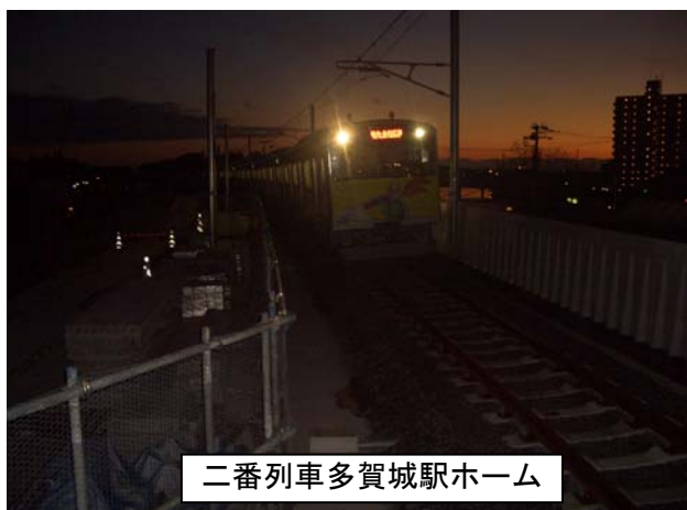
二番列車多賀城駅ホーム