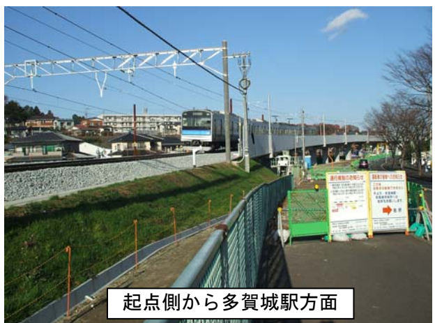
起点側から多賀城駅方面