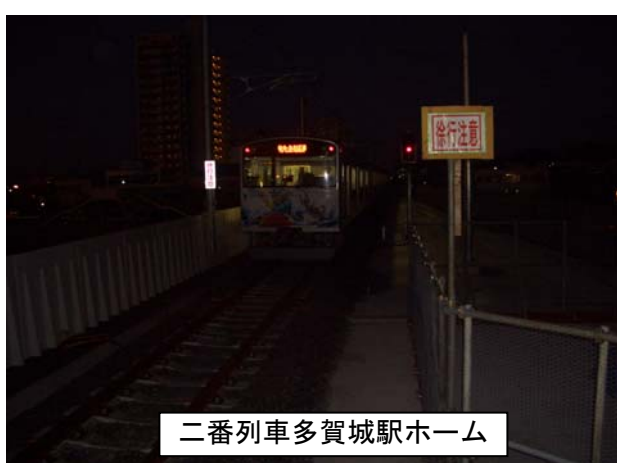
二番列車多賀城駅ホーム