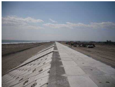
仙台湾南部海岸 (空港区間) 完成状況