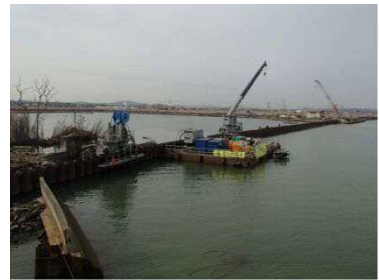
定川河川災害復旧工事状況