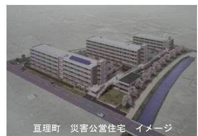
亘理町 災害公営住宅 イメージ