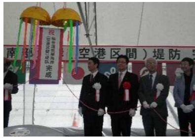
仙台湾南部海岸(空港区間)堤防完成式