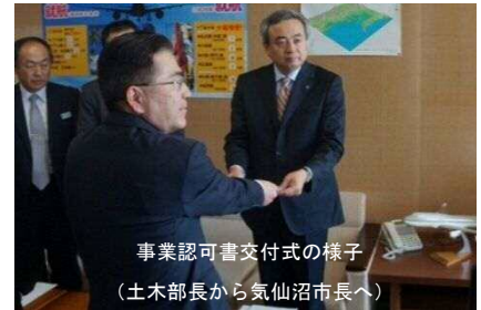
事業認可書交付式の様子 (土木部長から気仙沼市長へ)