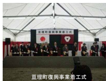
亘理町復興事業着工式