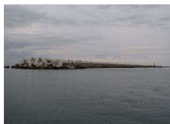
仙台港区新北防波堤 完成状況