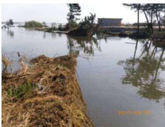
七北田川(右岸) 被災状況・復旧状況