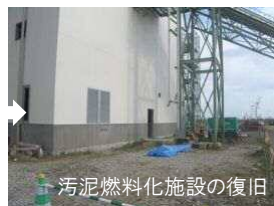
汚泥燃料化施設の復旧