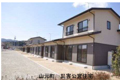
山元町 災害公営住宅