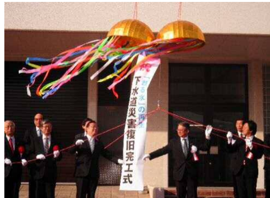
県南浄化センター下水道災害復旧完工式