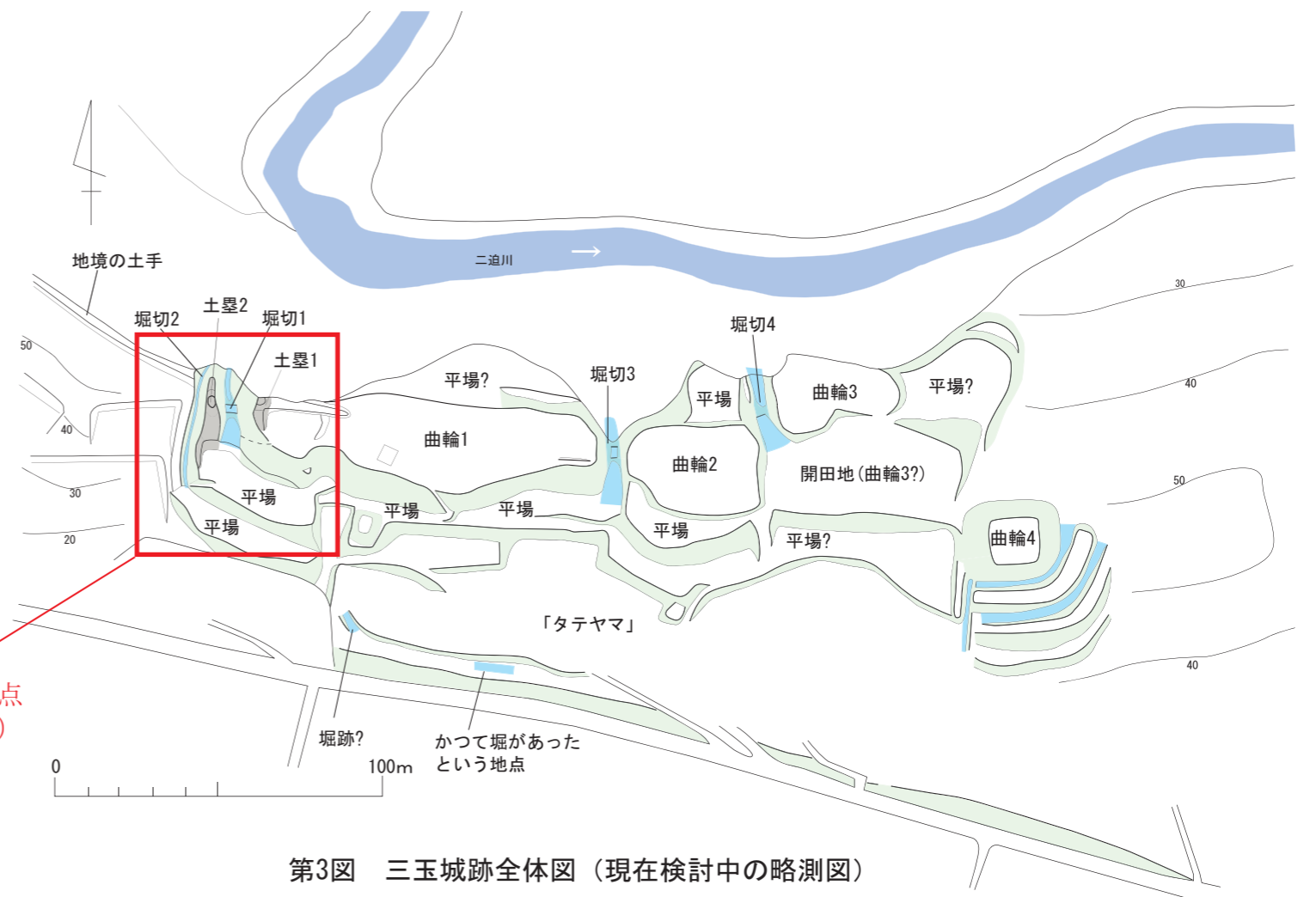
第3図 三玉城跡全体図（現在検討中の略測図）