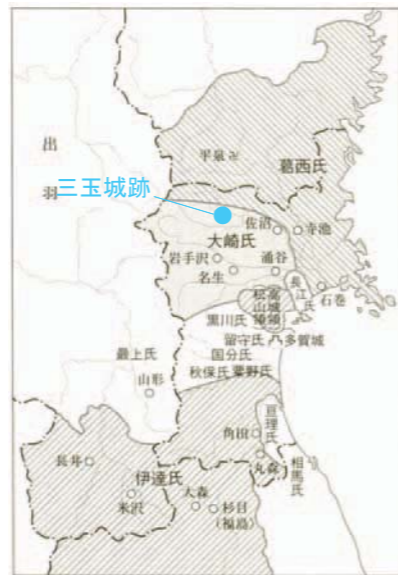
第2図 戦国時代の勢力分布図（天文期頃） （『宮城県の歴史』、山川出版社）