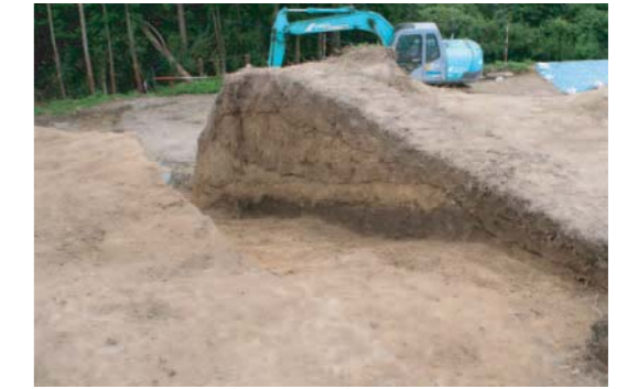
曲輪1の整地層 曲輪の西側から南側では幅2m、深さ1m（最大）の範囲を盛土することで平坦面を広くしている。