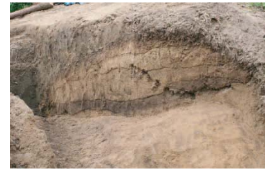
土塁3の断面 基底幅2.5m、最大1.5m。