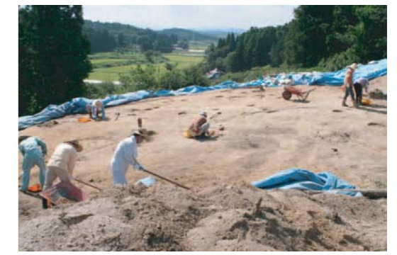
曲輪1調査風景 建物跡、鍛冶遺構、焼成遺構、土壇などを確認。現在精査中。