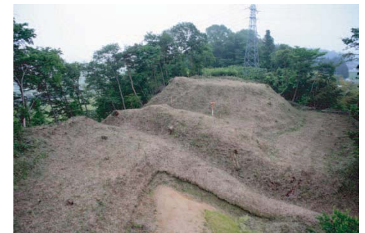
第5図 西上空からみた調査地点