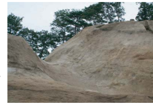
曲輪1、堀切1、土塁2 曲輪1より堀切1底面までは8mある。