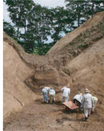
堀切部分の調査風景