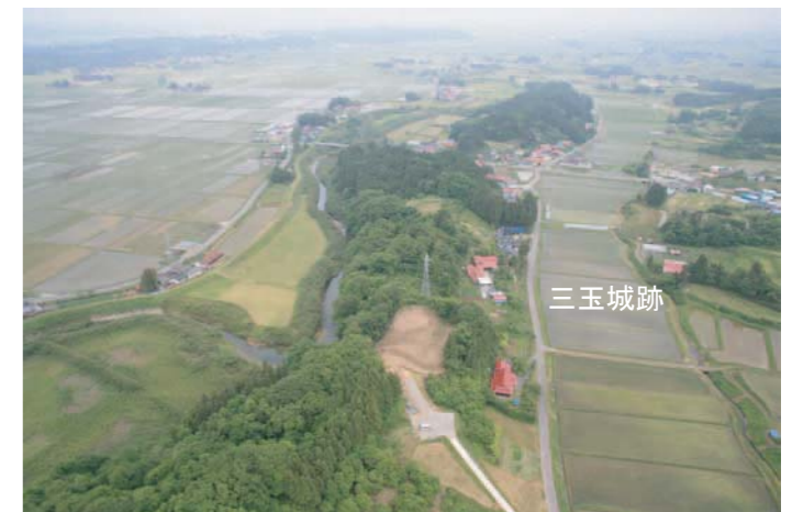
第4図 西上空からみた三玉城跡