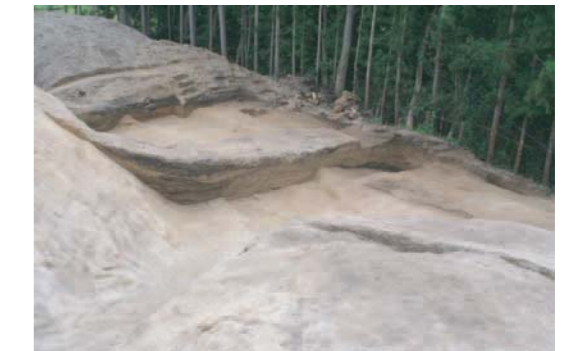
平場部分の堀切1 平場部分の堀切は東に向きを変える。2回掘り直しが行われ、3時期の変遷がある。