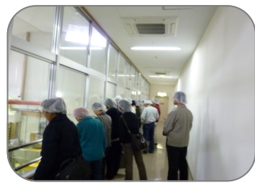
製造ラインの見学