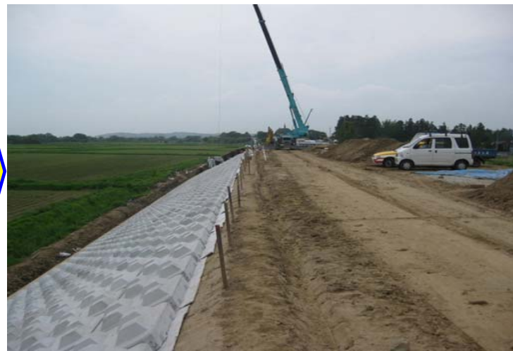
洪水時に耐得る護岸ブロックを川前側に施工します