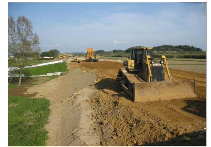
ゆるんだ土を取り除いた後、締め固めながら、もとどおりに土を盛ります