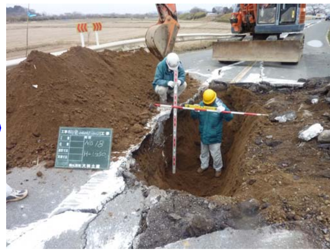
クラック(亀裂)に石灰水を流し込み、石灰の跡をたどりながら掘削して、クラックの深さや方向を調べます