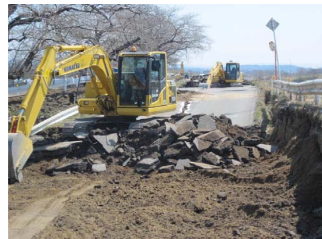
舗装を取り壊します