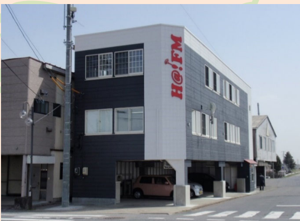
2020年2月に移転したばかりの新スタジオ