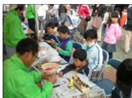
竹・どんぐり細工の制作体験