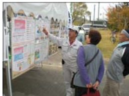
森林とたんぽの関係パネルとジオラマ展示・説明