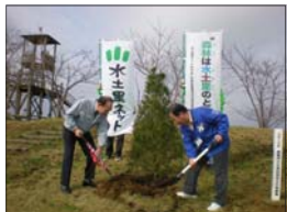
市長と支部長による記念植樹