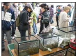
水路にすむ魚類の展示