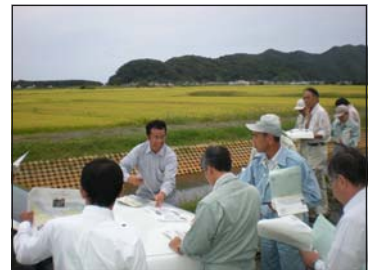
NN部職員によるほ場整備地区の説明