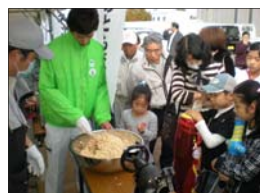
地元米のポン菓子配布