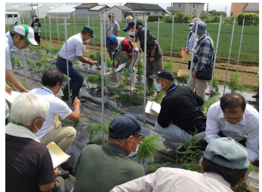
害虫を観察する様子

今回の勉強会では、講師よりアザミウマ類や茎枯れ病等の病害虫対策について説明があり、普及センターから農薬の使用やRACコードについて情報提供を行いました。参加者も黒い板の上でアスパラガスを軽く揺らすことで、アザミウマ類を目視して確認する方法を学びました。