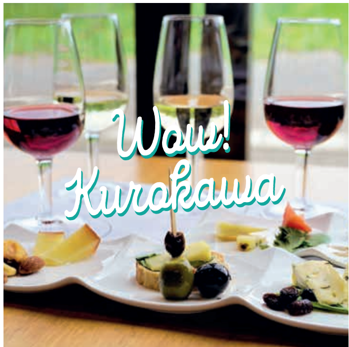
秋保ワイナリーでのマリアージュ (仙台市)

旅の醍醐味といえば、ご当地グルメ。特にオトナ旅には、地元の名産品や地酒を味わうことが大事なエッセンスです。そんな食道楽を満足させるのが、美食も銘酒もそろった仙台・黒川エリア。ワイナリーや酒蔵、ウイスキー蒸溜所もあり、お酒好きなら試飲や見学の楽しみも膨らみます。また、富谷市のブルーベリー、大郷町のモロヘイヤなど、緑あふれる風土で育った農産物の豊かさも魅力。道の駅やレストランでも、美味しい出会いが待っています。