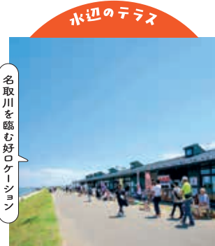
名取川を臨む好ロケーション

かまぼこやスイーツ、カフェなど多彩なお店がズラリ。かわまちてらす閑上(名取市)【電話】022-399-6848