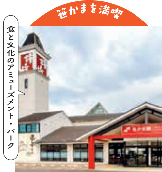
食と文化のアミューズメント・パーク

仙台名産笹かまぼこはもちろん、宮城の食や文化も満喫。鐘崎総本店笹かま館(仙台市)【電話】022-238-7170