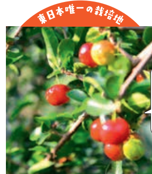
東日本唯一の栽培地

ビタミンCが豊富なアセロラを生で食べられます。亶理アセロラ園(亶理町)【電話】0223-35-3918