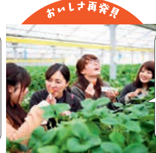
家族や友達とイチゴ狩り!

イチゴ狩りや直売所では完熟の果実が食べられます。亶理町観光協会(亶理町)【電話】0223-34-0513 株式会社地域振興公社(山元町)【電話】0223-38-1888