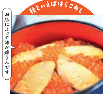
お店によって味が違うんです

鮭を煮た煮汁で炊いたご飯に身とはらこを乗せた逸品。亶理町観光協会(亶理町)【電話】0223-34-0513 株式会社地域振興公社(山元町)【電話】0223-38-1888