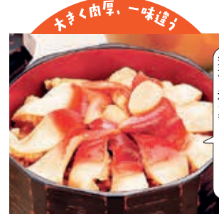
贅沢な海の幸、ほっきめし!!

噛むほどおいしい肉厚の身、醤油が甘みを引き立てます。亶理町観光協会(亶理町)【電話】0223-34-0513 株式会社地域振興公社(山元町)【電話】0223-38-1888