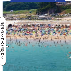
夏は多くの人で賑わう

東北で初めて開設された歴史のある葛蒲田海水浴場。●(一社)七ヶ浜町観光協会 (七ヶ浜町) 【電話】022-766-8205