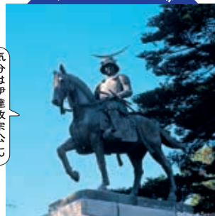
気分は伊達政宗公!

本丸跡からは仙台市内、太平洋を一望できます。●(公財)仙台観光国際協会 (仙台市) 【電話】022-268-9568