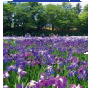
東北随一 百花繚乱

800種300万本のあやめが色鮮やかに咲き誇ります。●(多賀城市市民文化創造課 (多賀城市) 【電話】022-368-1141