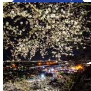
眺望も◎の桜の名所です

お花見シーズンにはライトアップも行われます。●(利府町商工観光課 (利府町) 【電話】022-767-2120