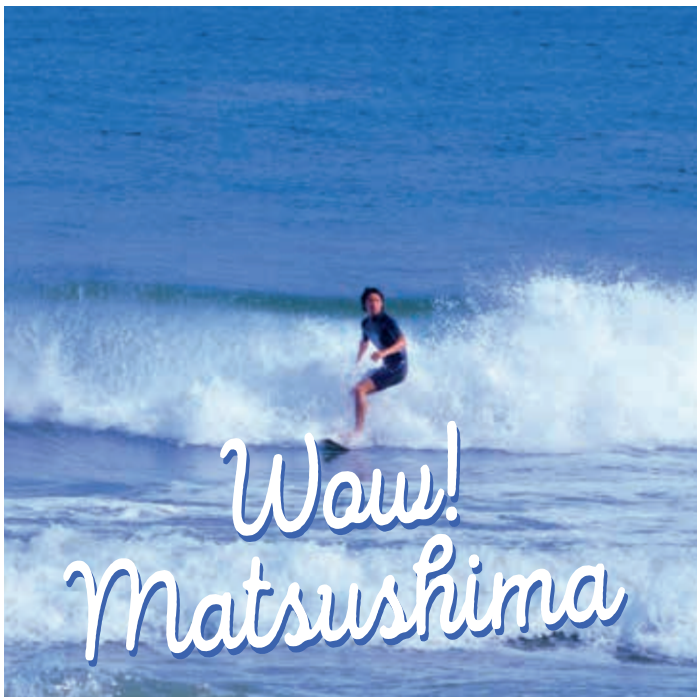
小豆浜でのサーフィン (七ヶ浜町)

日本三景に数えられる松島。穏やかな海に浮かぶ260もの島々には松の木が茂り、独特の景観を望めます。朝もやに霞む松島や、夕暮れの中の姿も、ため息が出るほど美しく、四六時中カメラが手放せません。また、伊達家ゆかりのお寺で数珠づくりに挑戦したり、自分で笹かまを焼いてみると、体験メニューも豊富。海と一体になれるアクティビティもおすすめです。歴史と伝統が宿るエリアを電車で便利に、徒歩でゆったり巡りましょう。