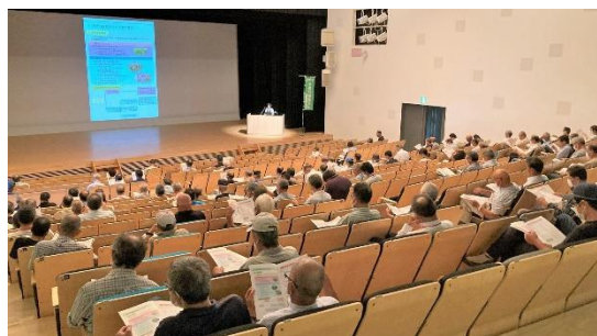
活動支援研修会の様子

8月10日（木）、遊楽館にて、多面的機能支払に係る活動支援研修会が開催されました。