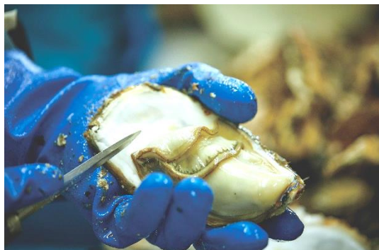
身が詰まった生カキ