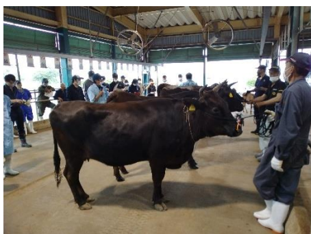
上位入賞牛は県共進会へ！

令和 5 年 6 月 30 日(金)、みやぎ総合家畜市場(美里町)において令和 5 年度石巻地域肉用牛共進会が開催されました。