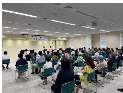
第2回コンサートの様子

令和5年度「山大 Sustainable ふれあいコンサート in 石巻合庁」について第2回を6月28日（水）、第3回を7月26日（水）に開催しました。