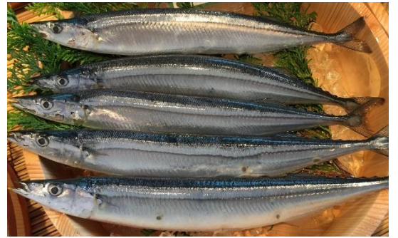
10月に旬を迎えるサンマ

秋に北の海から南下してくるサンマは三陸沖に差しかかる頃には、脂が乗り、おいしさのピークを迎えます。サンマには、今話題の健康機能に優れたEPAやDHAなど「高度不飽和脂肪酸」が多く、良質なタンパク質やミネラルを持つことから栄養の優等生と言えます。定番の『塩焼き』をはじめ『つみれ汁』や『つくだ煮』等でもおいしくお召し上がりいただけます。店頭で見かけた際には、是非、秋の味覚サンマをご堪能ください。