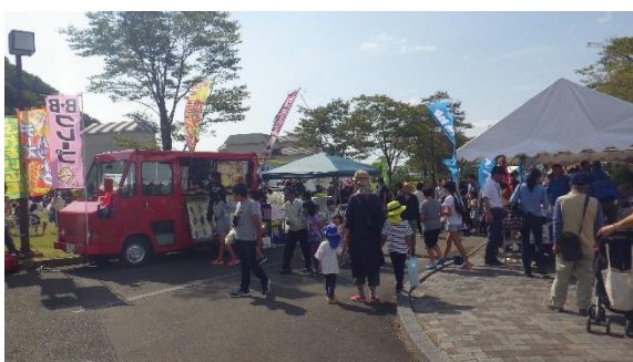
縁日コーナー出店状況（令和元年度開催時）