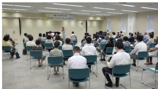
第3回コンサートの様子

また、コンサート同日に実施した販売会では、地元の水産会社や石巻北高等学校などが出店。農水産物や加工品等を、多くの方々に購入いただきました。