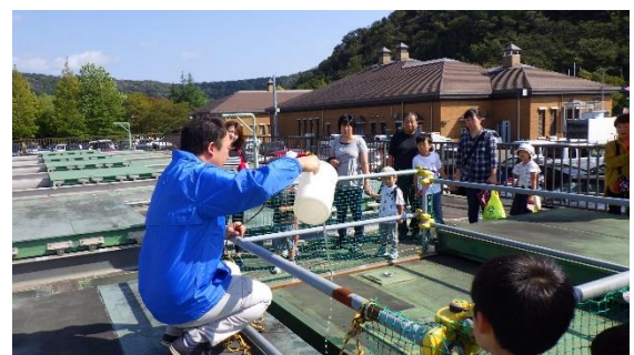
施設見学ツアー状況（令和元年度開催時）

下水道普及活動の一つとして、下水道まつりを開催します。 入場無料ですので、ぜひご参加ください。（雨天決行）