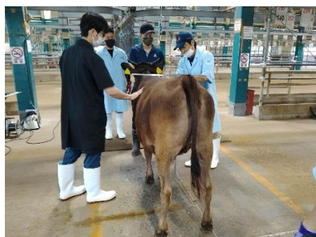
1 頭 1 頭丁寧に体高等を測定します。