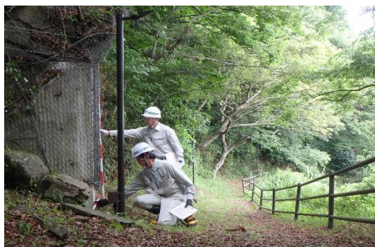
土留工の点検状況

県では、台風等の大雨や集中豪雨などの異常気象によって、山腹の崩壊や土石流が発生する恐れがある場所を山地災害危険地区に指定し、近隣住民の自主避難の判断や市町村が行う警戒避難体制の確立に役立ててもらうこととしています。