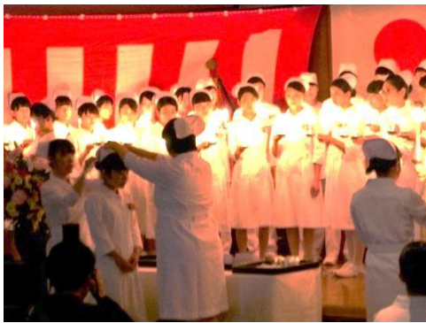
【石巻市医師会准看護学校戴帽式】

戴帽生の皆さんは，准看護学生は1年半後，看護学生は2年半後の春に，看護職として社会へ旅立つため，この戴帽式の感激を忘れず勉学や実習により一層取り組みます。やがて「看護の心」と「看護技術」を備えた看護職として成長し，石巻地域で長く活躍されることを心から期待します。