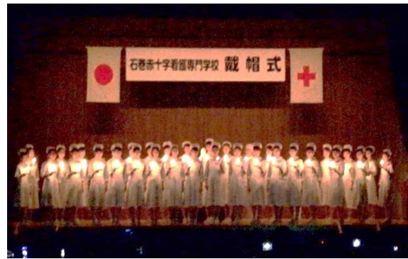
【石巻赤十字看護専門学校戴帽式】