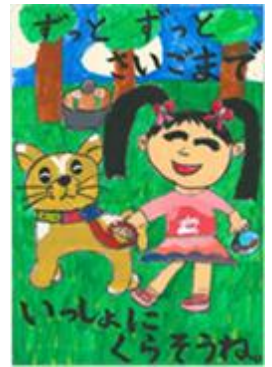
平成26年度動物愛護週間 ポスター採用作品

動物を飼うためには、動物の命をあずかる責任と、社会に対する責任の両方が求められます。飼い主は愛情を持って動物の健康と安全に気を配り、動物が周りの人に迷惑をかけないように、社会のルールやマナーを守って適正に飼いましょう。