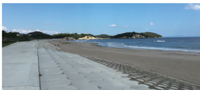
今年フルオープンとなった菖蒲田海水浴場 (七ヶ浜町)