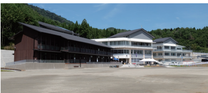
石巻市立雄勝小学校・雄勝中学校が完成 (石巻市)