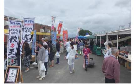
▲関上港朝市(名取市)

毎月更新の「復興の進捗状況」は、県ホームページでご覧いただけます。 http://www.pref.miyagi.jp/site/ej-earthquake/shintyoku.html