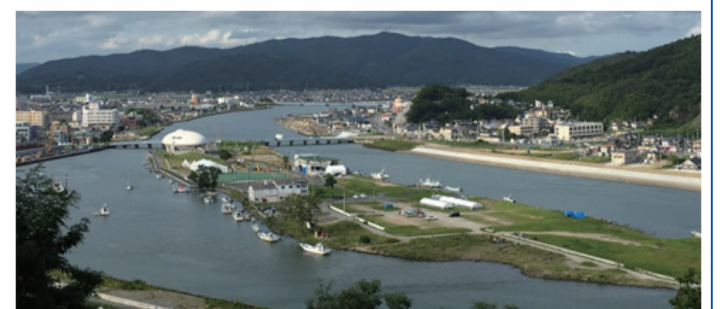
日和山公園から見た旧北上川 (石巻市)