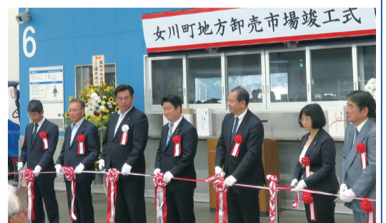
5月30日 女川町地方卸売市場の竣工式(女川町)