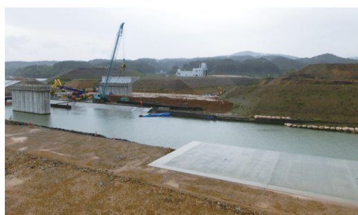
かさ上げ工事の進む志津川市街地(南三陸町)