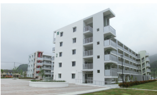
鹿折南住宅(気仙沼市)