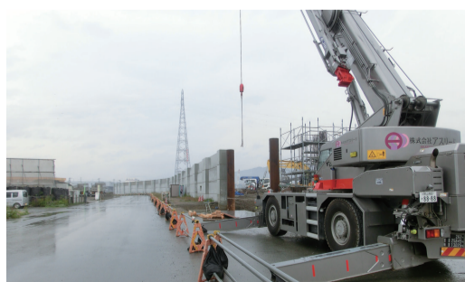
整備進む商港岸壁の防波堤(気仙沼市)