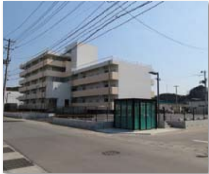
東松島市・鳴瀬給食センター跡地地区 (平成26年3月完成)