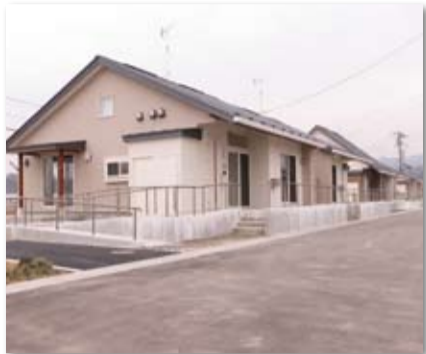
山元町・新山下駅周辺地区(第2期) (平成26年3月完成)

○各地区・団地の位置などの詳細は宮城県復興住宅整備室のホームページをご覧ください。 http://www.pref.miyagi.jp/soshiki/fukujuu/