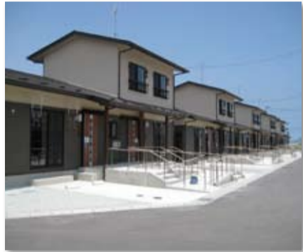
山元町・新山下駅周辺地区(第1期) (平成25年6月完成)