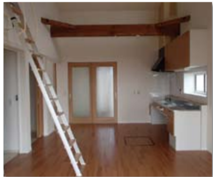
山元町・新山下駅周辺地区(第1期) (平成25年6月完成)