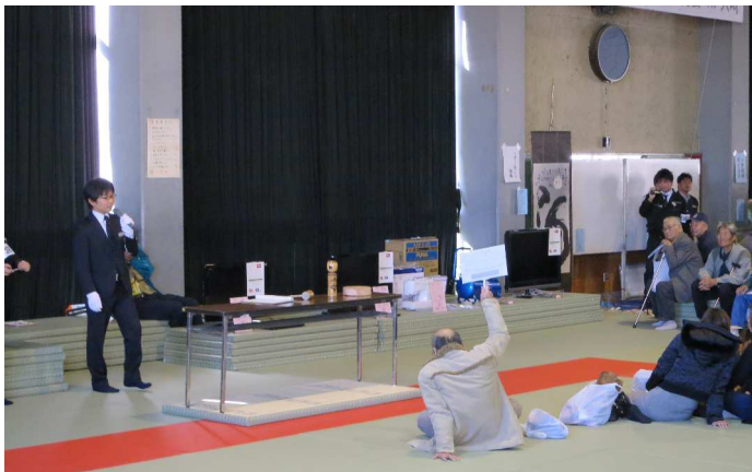
オークション風景

立冬を迎えた平成26年11月8日（土）、大崎市古川武道館において宮城県市町村合同公売会in大崎が開催されました。宮城県と市町村の差押え品を一同に介した即売方式の合同公売会は、県内初開催ということもあり、大崎市民をはじめ県内外から多くの来場者で