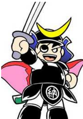
機構キャラクター おさむね君

http://www.pref.miyagi.jp/soshiki/choutai/