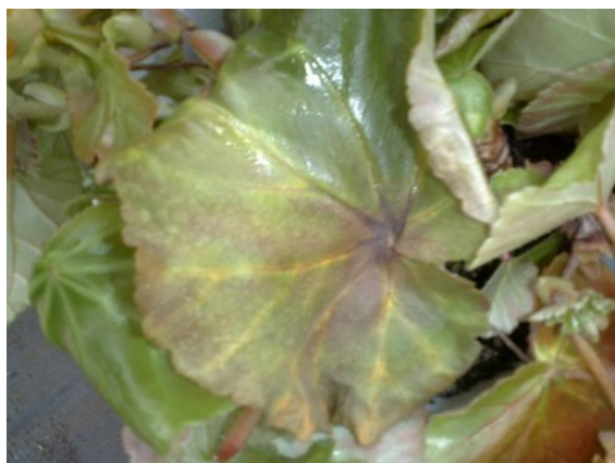
葉の初期症状(葉脈に沿った黄化)