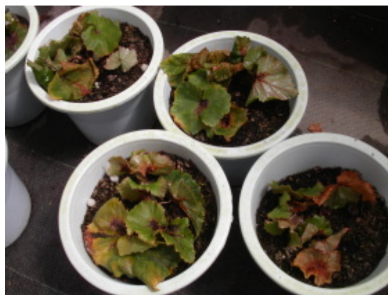
株の症状(葉の黄化, 褐変, 葉枯れ)