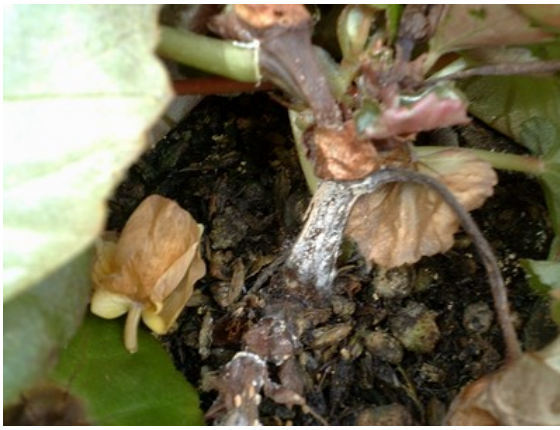
地際部の腐敗症状と分生子塊