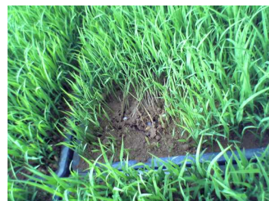
フザリウム属菌 ( Fusarium spp. )