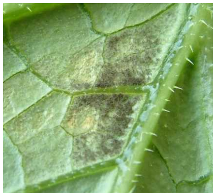
葉裏に生じたかび