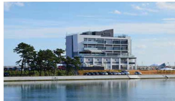
名取市サイクルスポーツセンター