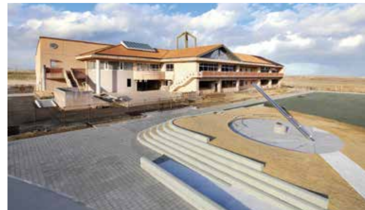
山元町震災遺構中浜小学校