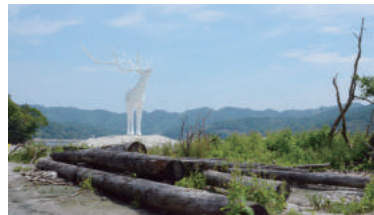
石巻市を中心に開催された芸術・音楽・食の総合祭「リボンアート・フェスティバル2017」(石巻市ほか)