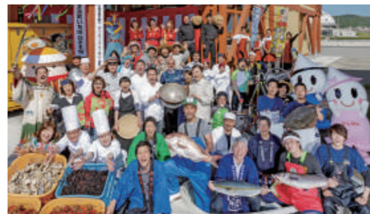
地元の新鮮な魚介類や野菜の物販・飲食が楽しめる「いしのまき元気いちば」がオープン(石巻市)