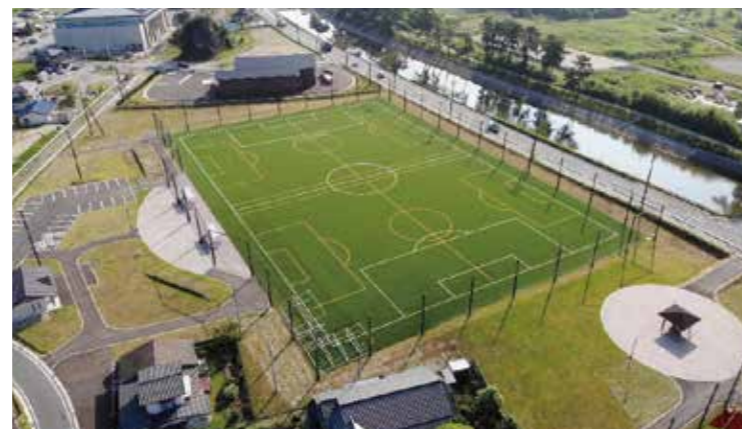
奥松島運動公園