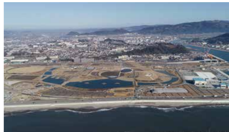
石巻南浜津波復興祈念公園