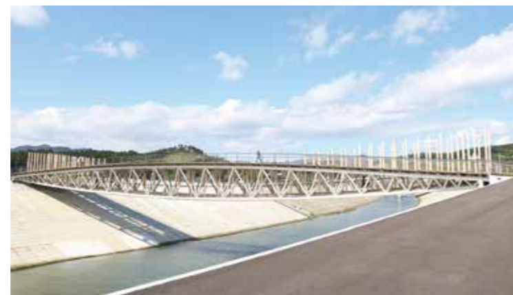
南三陸町震災復興祈念公園とさんさん商店街を繋ぐ「中橋」