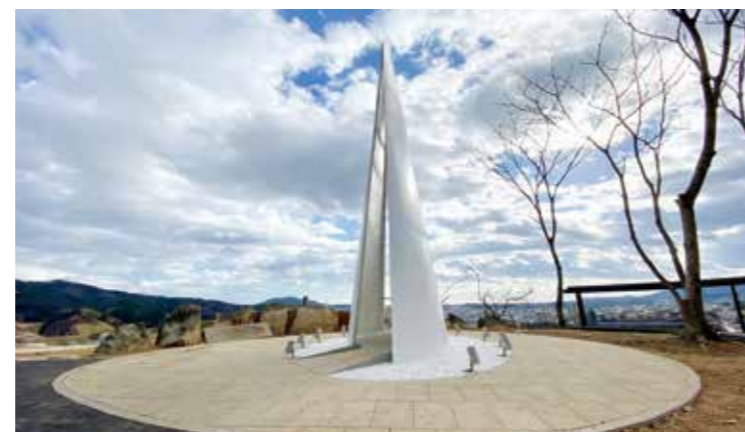
気仙沼市復興祈念公園