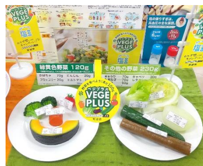
課内でも健康情報の啓発を実施中