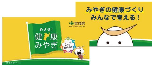
図2: ホームページ掲載中の動画