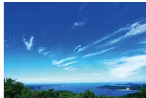
女川の空と海(女川町)