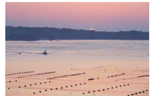
養殖いかだが浮かぶ志津川湾(南三陸町)