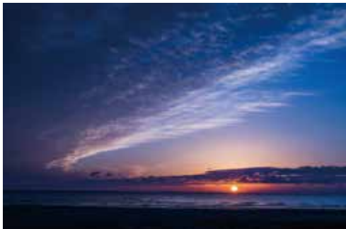
鳥の海からの日の出 (巨理町)