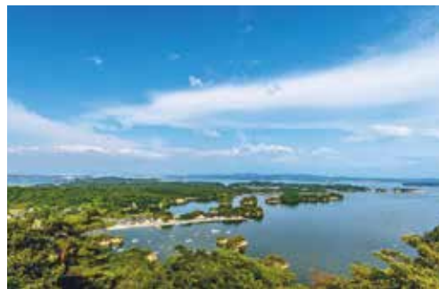
日本三景の松島湾 (松島町)