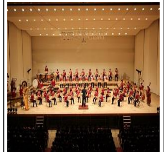
④ 吹奏楽部定期演奏会