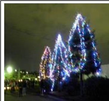
⑤ イルミネーション点灯