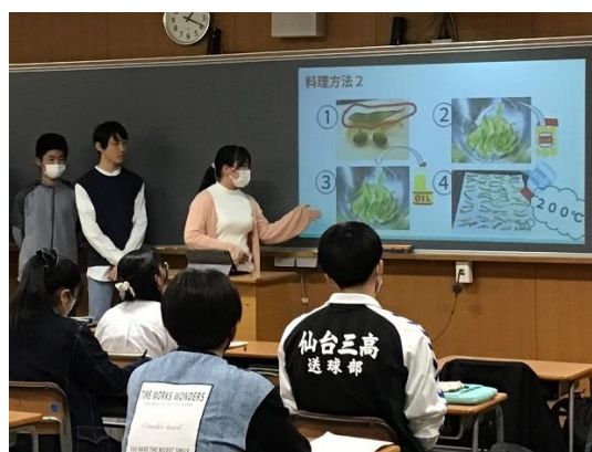
クローズドブック（BYAD）を活用した口頭発表