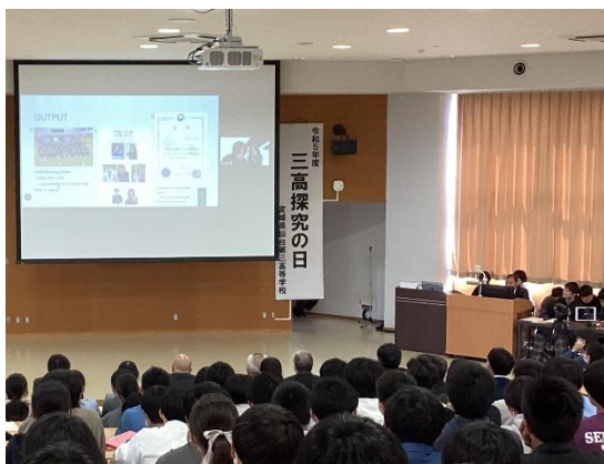
韓国チョンリョル女子高校との交流