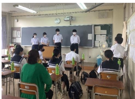
< 昨年度の懇談会の様子 >

参加御希望の方はFAXまたはメールで申し込んでください。詳しくは高校教育課又は本校のホームページを御覧ください。