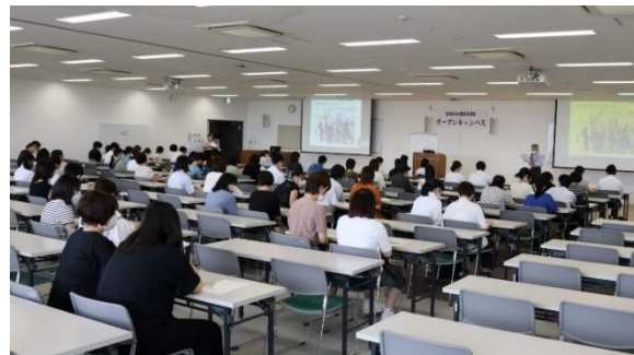
<令和4年8月オープンキャンパス>