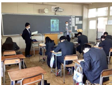
言語・自然科学系列

「村高生は、しっかりした生活態度と強い意志で進路希望を達成しようとする生徒です。」