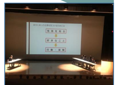
【デュアルシステム学習報告会】