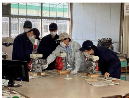
機械・自動車系列