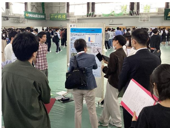
ポスター発表（体育館）

今後もSSH（スーパーサイエンスハイスクール）指定校として、科学的な探究活動を支える「尚志ヶ丘フィールド」と「三高型STEAM教育」の開発と実践を通して、生徒の知的好奇心の育成に力を入れていきます。次の研究発表イベントは11月9日（木）イノベーションフェスタです。