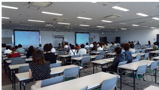
<令和2年8月二期入学説明会>

二期入学説明会 ：午前10時受付 午前10時30分 開会 オープンキャンパス ：午後1時30分 受付 午後2時 開会