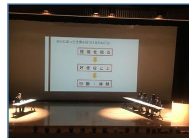
【デュアルシステム学習発表会】