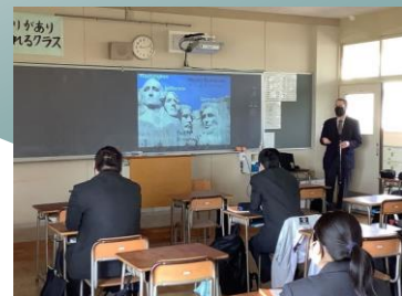
言語・自然科学系列