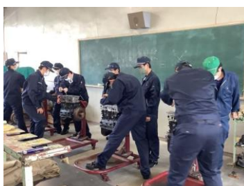
機械・自動車系列