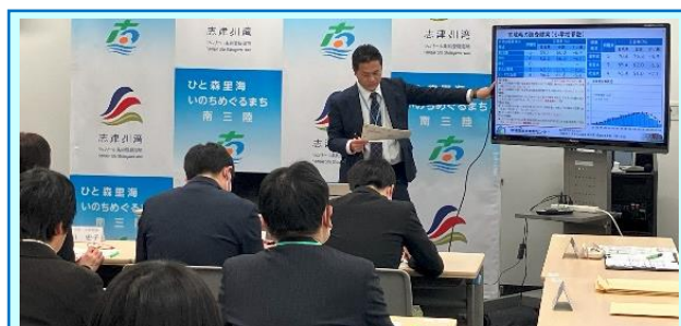
第4回「南三陸町役場で行った研修会」

「図形の移動」の授業実践が行われました。合同な図形の移動について説明する課題に対して、ICTを効果的に活用し、自分の言葉で説明することができました。