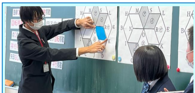
第3回「歌津中の数学の授業(1年)」

「倍の見方」の授業実践が行われました。2種類の包帯のどちらがよく伸びるかを説明する課題に対して、養護教諭による動画の問題提示により、意欲的に学習することができました。