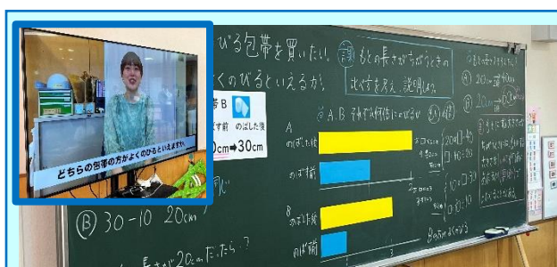
第2回「伊里前小の算数の授業(4年)」

「小数の倍」の授業実践が行われました。小数で表された道のりの倍の求め方を説明する課題に対して、互いの学習状況を見て交流し、説明し合うことができました。