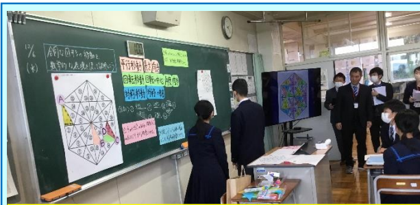
第4回「志津川中の数学の授業(1年)」

「分数と小数、整数の関係」の授業実践が行われました。算数コーナーを活用して既習事項を振り返らせ、紙テープを黒板に貼って倍の表し方について理解を深めました。