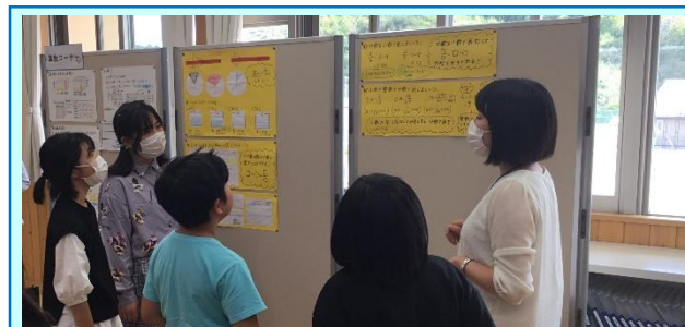
第3回「戸倉小の算数の授業(5年)」

「余りのあるわり算」の授業実践が行われました。23個のケーキを4個ずつ入れるために必要な箱数を求める課題に対して、半具体物を用いて理解を深める授業でした。