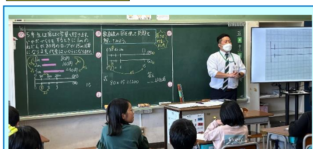
第1回「志津川小の算数の授業(5年)」

「変わり方を調べよう」の授業実践が行われました。宿泊研修で使うロープの代金を求める課題に対して、数直線を活用して代金を求め、ペアや全体で共有しました。