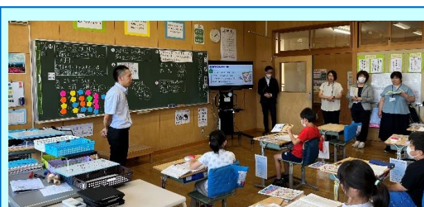
第2回「入谷小の算数の授業(3年)」

「変わり方を調べよう」の授業実践が行われました。宿泊研修で使うロープの代金を求める課題に対して、数直線を活用して代金を求め、ペアや全体で共有しました。